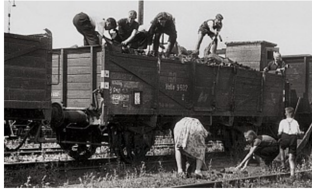
Kohlendiebstahl in der Nachkriegszeit.